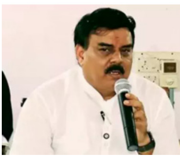
చేసుకోవచ్చు. పట్టణాల్లోని వినియోగదారులను ఎల్పీజీ నుంచి పీఎన్జీ వైపు మళ్లిస్తాం. రాష్ట్రంలో ఎక్కడా పెట్రోల్, డీజిల్ కొరత లేదు" అని తెలిపారు.

అమరావతి: ఏపీలో ఎక్కడా గ్యాస్ కొరత లేదని మంత్రి నాదెండ్ల మనోహర్ అన్నారు. సోషల్ మీడియాలో వచ్చే వదంతులతో కొందరు ముందు జాగ్రత్తగా బుకింగ్లు చేస్తున్నారని చెప్పారు. పైజెట్ గ్యాస్పై కొత్త పాలసీ తీసుకువచ్చేలా ప్రభుత్వం త్వరలో నిర్ణయం తీసుకుంటుందన్నారు.