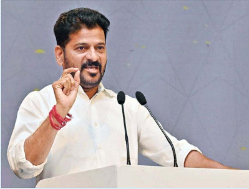
హైదరాబాద్, మార్చి 25,

తెలంగాణ సీఎం రేవంత్ రెడ్డి బీఆర్ఎస్ పార్టీని వ్యూహాత్మకంగా బలహీనం చేయాలనుకుంటున్నారు. ఇందులో భాగంగా ఆయన మొదటగా ఆ పార్టీ ముఖ్యనేతలను బలహీనం చేయాలనుకుంటున్నారు. కేసీఆర్, కేటీఆర్, హరీష్ రావుల కంచుకోటలను బద్దలు కొట్టాలనుకుంటున్నారు. సిద్దిపేట, గజ్వేల్, సిరిసిల్ల ఈ మూడు కేవలం నియోజకవర్గాలు మాత్రమే కాదు, బీఆర్ఎస్ పార్టీకి కంచుకోటలు. ముఖ్యమంత్రి రేవంత్ రెడ్డి ఇప్పుడు ఈ కోటలనే లక్ష్యంగా చేసుకుని, గులాబీ దళపతులైన హరీష్ రావు, కేసీఆర్, కేటీఆర్లను రాజకీయంగా బలహీనపరిచేందుకు వక్కా వ్యూహంతో ముందుకు సాగుతున్నారు. తెలంగాణలో అధికారాన్ని నిలబెట్టుకోవాలనుకుంటున్న కాంగ్రెస్ పార్టీ, ఇప్పుడు బీఆర్ఎస్ అగ్రనేతల సొంత నియోజకవర్గాల్లో ఆ పార్టీని నామరూపాలు లేకుండా చేయడమే లక్ష్యంగా పెట్టుకుంది. సిద్దిపేటలో నిర్వహించిన బహిరంగ సభలో ముఖ్యమంత్రి రేవంత్ రెడ్డి చేసిన ప్రసంగం దీనికి స్పష్టమైన సంతకం. హరీష్ రావు ప్రాతినిధ్యం వహిస్తున్న సిద్దిపేటలో ఆడుగుపెట్టిన రేవంత్, అక్కడ అభివృద్ధిలో లోపాలను ఎత్తిచూపుతూనే, రాజకీయంగా ఆధిపత్యం సాధించేందుకు పావులు కదుపుతున్నారు. కేవలం గెలవడమే కాదు, ప్రత్యర్థి నాయకత్వాన్ని స్థానికంగా దెబ్బతీయాలన్నది రేవంత్ మాస్టర్ ప్లాన్. రేవంత్ రెడ్డి అనుకుంటున్నంత సులభంగా ఈ మూడు నియోజకవర్గాల్లో మార్పు రావడం అసాధ్యమని రాజకీయ విశ్లేషకులు